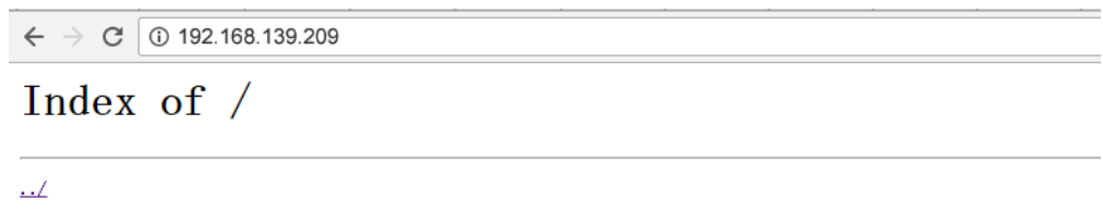
图8-3 nginx 部署成功